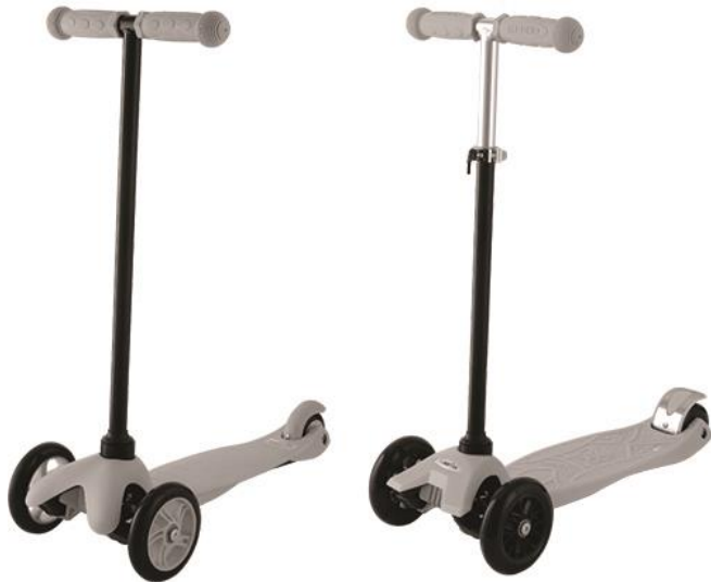
AZARIA S909B и AZARIA S910